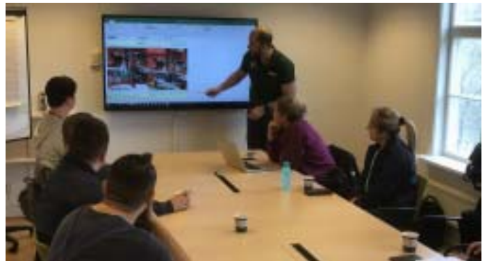
Kaizenteamet går igenom veckans genomförda Kaizen's ihop med BE & SPS teamet.