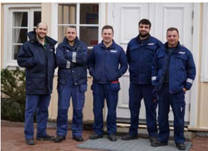
Delar av Kaizen-teamet