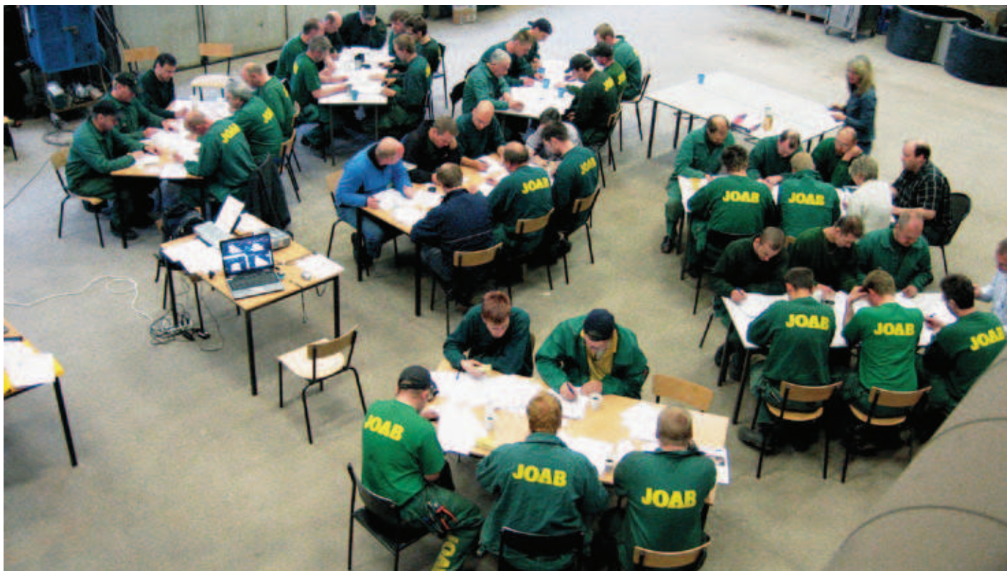
Motstånd mot förändringar. När ca 40% är positiva så innebär det draghjälp i förändringen. Innan dess måste man kämpa på.

Det spelar ingen större roll hur bra förbättringsverktyg, förbättringstavlor eller andra hjälpmedel man har om ingen vill använda dem. Och för att komma dit måste det finnas en vilja och ett engagemang. Det går att införa förbättringsverktyg och rutiner men det går inte att "införa" ett engagemang. Ett bra förankringsarbete i kombination med en effektiv utbildning kan lägga grunden till ett bra engagemang. En förutsättning är naturligtvis också att che-